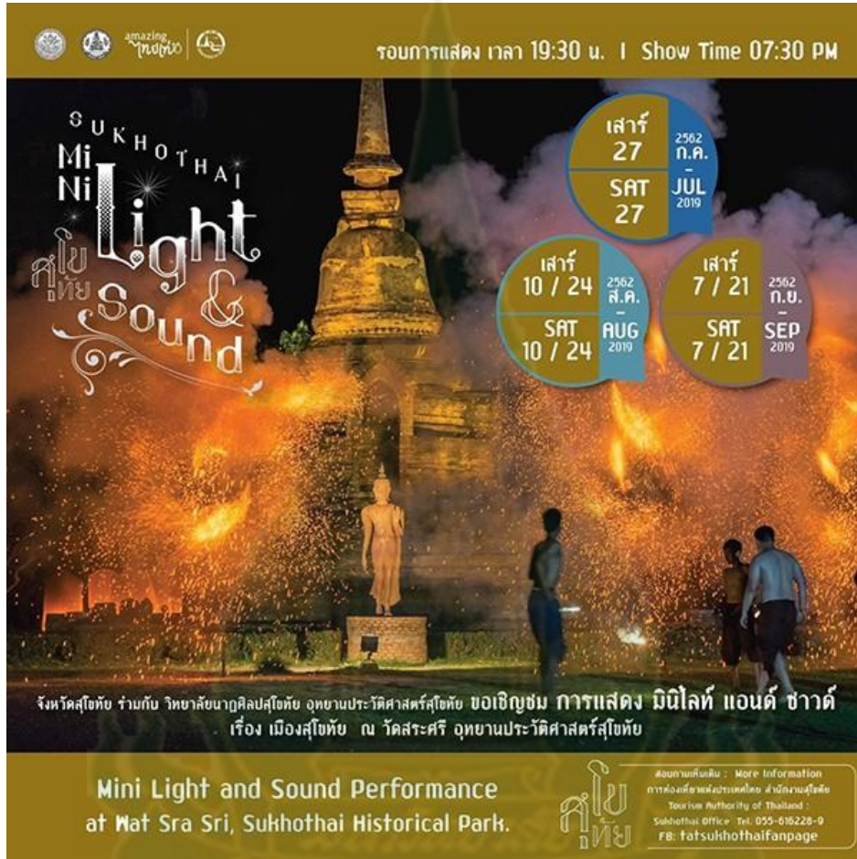
ภาพที่ 4.6 Mini Light and Sound Performance ที่อุทยานประวัติศาสตร์สุโขทัย

จังหวัดสุโขทัย ร่วมกับการท่องเที่ยวแห่งประเทศไทย อุทยานประวัติศาสตร์สุโขทัย วิทยาลัยนาฏศิลป์ จัดงานแสดงมินิแสงเสียง (Mini Light & Sound Performance) ที่เป็นการแสดงการเล่าเรื่องเมืองสุโขทัย ที่ย่อมาจากงานแสดงวันลอยกระทง ใช้เวลาประมาณ 45 นาที นักท่องเที่ยวเข้าชมฟรี ณ บริเวณวัดสระศรี ที่มีลักษณะเป็นเกาะกลางน้ำ เพื่อสร้างมูลค่าเพิ่มให้แก่สินค้าท่องเที่ยว คืออุทยานประวัติศาสตร์ที่เป็นแหล่งท่องเที่ยวมรดกทางวัฒนธรรม โดยจัดให้มีเดือนละ 2 ครั้งในวันเสาร์ นอกจากนี้ ในทุกวันเสาร์ จะมีการเปิดไฟอุทยานฯ เพื่อชมความงาม ตั้งแต่เวลา 18.00-20.00 น เป็นลักษณะไฟสีส้ม