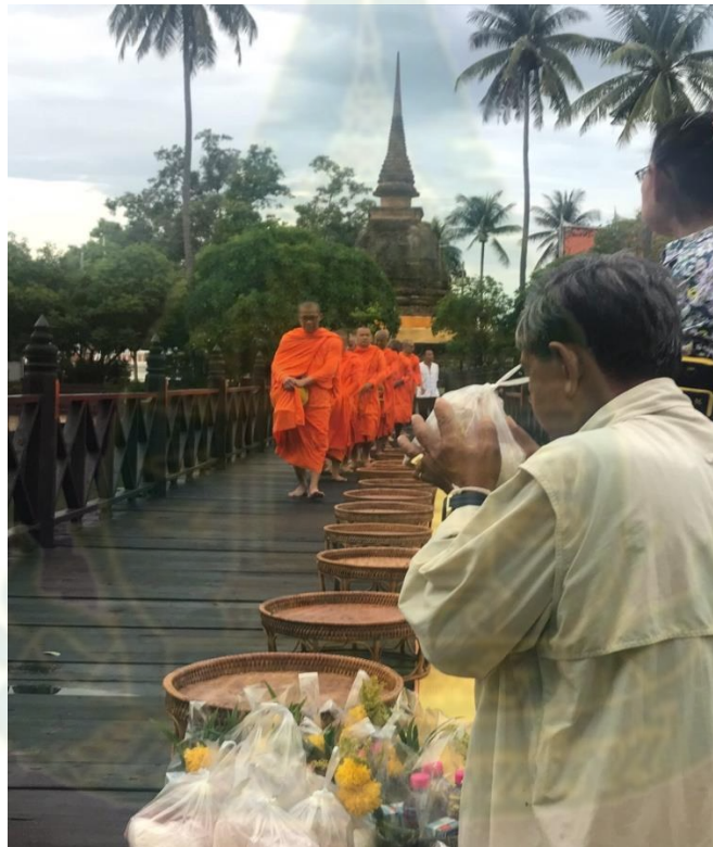
ภาพที่ 4.5 ใส่บาตรสะพานบุญ รับอรุณสุโขทัย วัดตระพังทอง

การท่องเที่ยวแห่งประเทศไทยช่วยจัดกิจกรรมอนุรักษ์วัฒนธรรม เช่น กิจกรรมตักบาตรรับอรุณที่วัดตระพังทอง ทุกเช้า เวลา 6.30 น. และมีกิจกรรม DIY (Do it Yourself) ให้นักท่องเที่ยวได้เรียนรู้ศิลปวัฒนธรรมท้องถิ่น เช่น การเขียนลายสังคโลก การพิมพ์พระ เป็นต้น ที่นักท่องเที่ยวจะได้ลงมือทำและเมื่อทำเสร็จจะส่งไปให้นักท่องเที่ยวเป็นของที่ระลึก