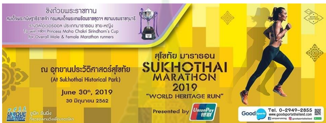
ภาพที่ 4.4 งานวิ่งในแหล่งมรดกโลก

การจัด event ต่าง ๆ ผู้จัดงานจะต้องขออนุญาตอุทยานฯ เนื่องจากเป็นหน่วยงานที่มีหน้าที่ดูแลรักษาโบราณสถานและจัดการพื้นที่อุทยานประวัติศาสตร์สุโขทัย อุทยานฯ ได้อนุญาตให้จัด event สำคัญ เช่น งานเทศกาลประเพณีเผาเทียนเล่นไฟ (ลอยกระทง) เป็นประจำปีทุกปี งานวิ่งในแหล่งมรดกโลก (World Heritage Run) ปีนี้จัดที่อุทยานประวัติศาสตร์สุโขทัย ซึ่งกลุ่ม Unique Running ประเทศญี่ปุ่นเป็นผู้จัดงาน ร่วมกับการท่องเที่ยวและกีฬาประจำจังหวัด การท่องเที่ยวแห่งประเทศไทยได้ขอถ้วยพระราชทานจากสมเด็จพระกนิษฐาธิราชเจ้า กรมสมเด็จพระเทพรัตนสุภาฯ สยามบรมราชกุมารี มีผู้ร่วมงานจำนวนกว่า 12,000 คน ระหว่างวันที่ 29-30 มิถุนายน 2562 ก่อให้เกิดรายได้แก่ประชาชนและธุรกิจในการให้บริการรองรับนักท่องเที่ยวมารathonและผู้ติดตามจำนวนมาก เช่น ที่พักแรม ร้านอาหารและเครื่องดื่ม ยานพาหนะขนส่งในพื้นที่ เป็นต้น