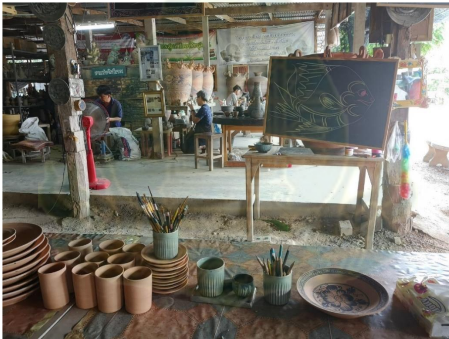
ภาพที่ 4.3 การเรียนเขียนลายสังคโลก