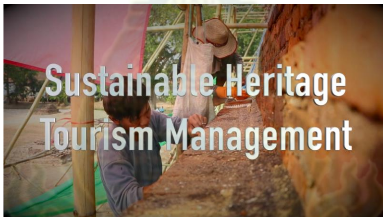
ตอนที่ 2 นำเสนอแนวทางการจัดการมรดกทางวัฒนธรรมเพื่อการท่องเที่ยวอย่างยั่งยืน