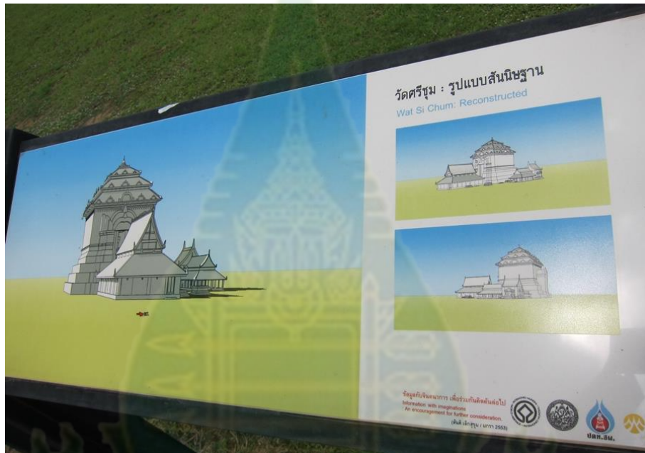
ภาพที่ 4.1 ป้าย Reconstructed Model ของวัดศรีชุม

ในอุทยานฯ มีการจัดทำ Zoning มีการจัดทำเส้นทางจักรยาน จัดบริการรถราง รถไฟฟ้า เพื่อช่วยการเดินทางเที่ยวชมแหล่งท่องเที่ยวต่าง ๆ ในอุทยานแห่งชาติ และปัจจุบันห้ามรถยนต์ รถทัวร์นำเที่ยว เข้าเขตอุทยานฯ เป็นการช่วยรักษาสีเขียวแวดล้อมในอุทยานฯ มีการจัดทำป้ายสื่อความหมายเพื่อการท่องเที่ยวตามแหล่งท่องเที่ยวสำคัญในอุทยานฯ แต่เดิมเป็นป้ายสื่อความหมาย ต่อมามีการจัดทำป้าย Reconstructed Model และมีการสแกนข้อมูลจาก QR Code ได้แล้ว แต่อุทยานฯ ยังขาดงบประมาณสนับสนุน อุทยานฯ ควรให้มีงบประมาณจากกรมศิลปากรเพื่อจัดการและปรับปรุงพื้นที่ทางกายภาพให้ดีขึ้น