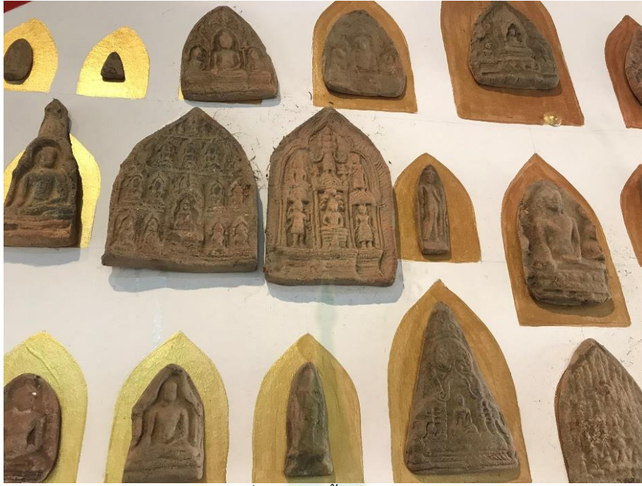
ภาพที่ 4.2 การปั้นพระพิมพ์แบบต่าง ๆ