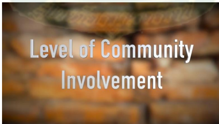
ตอนที่ 3 การมีส่วนร่วมของชุมชนในการจัดการมรดกทางวัฒนธรรมเพื่อการท่องเที่ยว