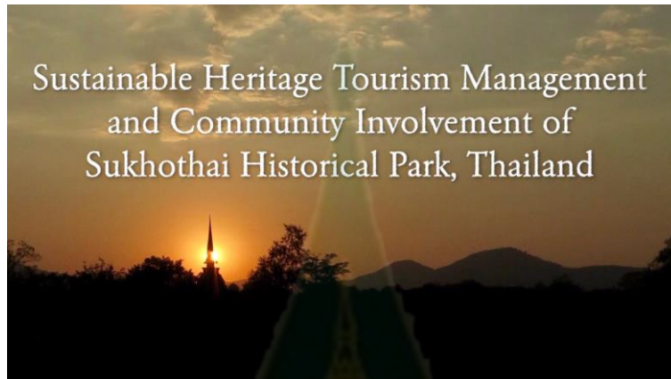
ตอนที่ 1 นำเสนอความเป็นมาและรายละเอียดของอุทยานประวัติศาสตร์สุโขทัย

ผลการวิจัยที่ตอบวัตถุประสงค์ข้อ 3 คือ ผลการจัดทำ Online Education Resources เรื่องการจัดการมรดกทางวัฒนธรรมเพื่อการท่องเที่ยวซึ่งเป็นรายการเรื่อง Sustainable Heritage Tourism Management and Community Involvement of Sukhothai Historical Park, Thailand มีความยาวประมาณ 20 นาที แบ่งออกเป็น 3 ตอน ดังแสดงในภาคผนวก 7 ดังนี้